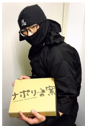
民泊施設配達時の忍者ユニフォーム